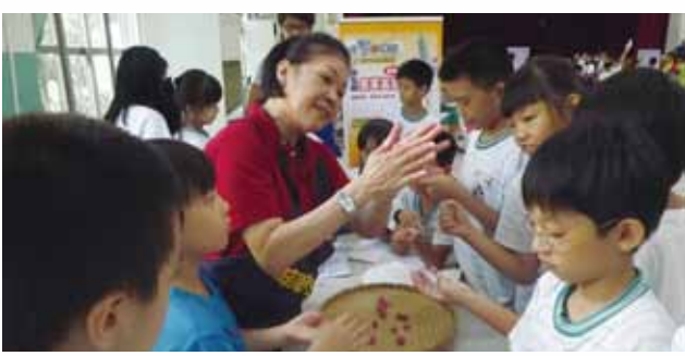
▲客家文化體驗服務~客家湯圓讚喔