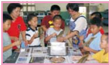
家長會請雲林夥伴體驗米食文化

歡樂的時光總是過得特別快，三天的時間一下子就要過去，雲林的夥伴們一早就在全校師生的夾道歡送下離開學校，進行第三天的臺北交流活動。第一站是木柵動物園，園區安排了兩位老師導覽園區，當孩子們看到無尾熊、熊貓、企鵝等各種動物時，都不時的發出驚呼。最後一站是搭乘貓空纜車，整個木柵地區的風貌盡收眼簾，貓空的茶鄉風情與雲林的茶文化有異曲同工之妙。回程的纜車上，雲林的孩子們紛紛表示還想到延平國小來，臺北真得有很多好玩的地方，這一次也結交了許多的好朋友，很感謝學校師長的安排，未來有機會一定會再來臺北。