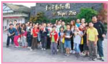
雲林夥伴參觀動物園並搭乘纜車