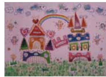
402 曾詠琳 / 炫麗的城堡