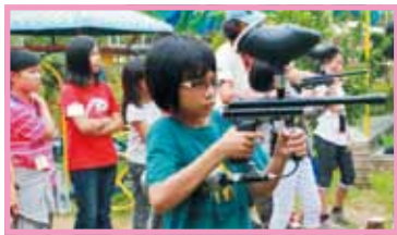
目標正前方開保險開始射擊