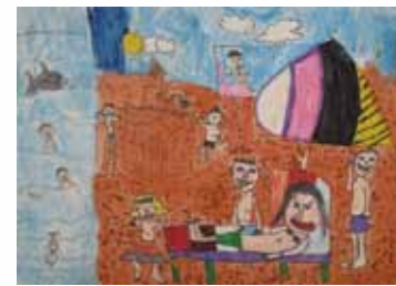
303 吳柏佑 / 沙灘上