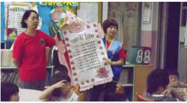
▲大手牽小手~一年級新生圖書館利用教育