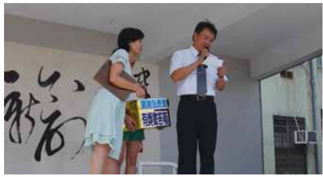
▲敬師活動~猜猜我是誰有獎徵答