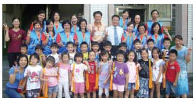
▲小一閱讀起步走~親子共讀方案