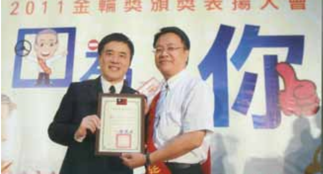
▲本校榮獲2011臺北市交通安全金輪獎