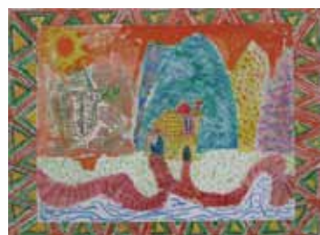
104 戴章豐 / 風景點線面