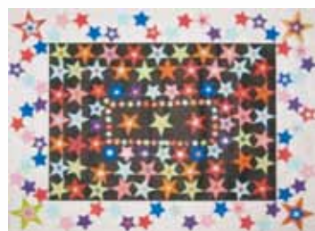
302 戴永章 / 平面設計