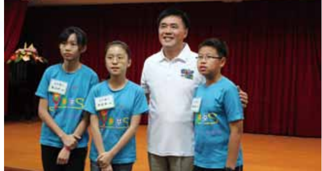
▲「你30，兒童安全好OK！」記者會，與市長合影