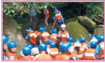
那路雖然艱困我們仍然奮勇向上爬

同學陪同我們一起進行各項學習課程，讓我們對於「華南咖啡原鄉」留下非常深刻的印象，也完成第二天的特色遊學課程。