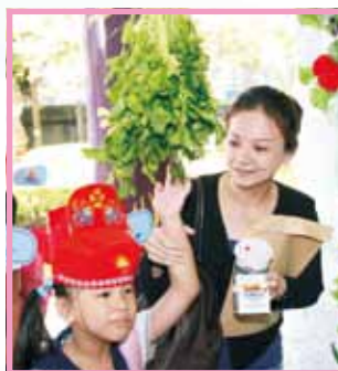
摸一摸芹菜，穿越勤學門，就要做個勤學認真的好學生了。