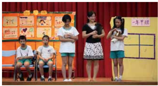
▲迎新戲劇表演~小阿力的大學校