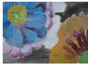
603 蔡采容 / 花團錦簇