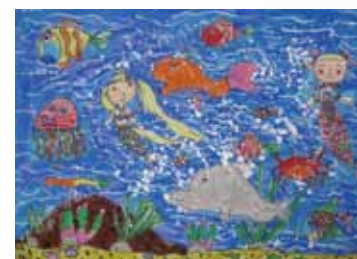
101 江育欣 / 海底世界