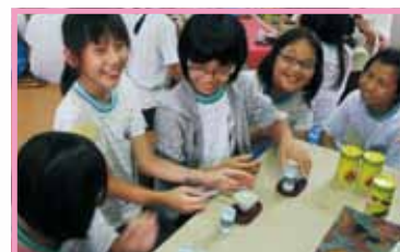
學習茶道是一種很特別的經驗