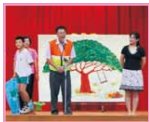
連校長、主任、護士阿姨、圖書阿姨、總務處阿姨都參與演出嘍！