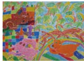
402 林彤怡 / 神秘黑洞