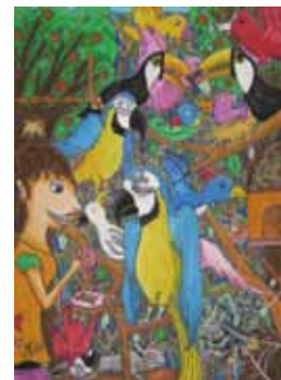
504 廖心瑜 / 餵食趣