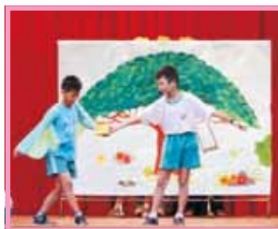
首度由學生和志工媽媽共同演出，介紹新生生活的大小事，讓孩子在活潑輕鬆的氣氛中認識這個大家庭。