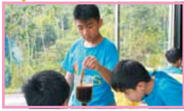
能喝上一口自己沖泡的咖啡真是美味啊