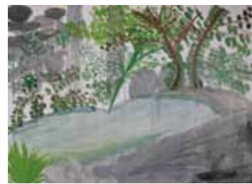
406 曾安祺 / 校園角落