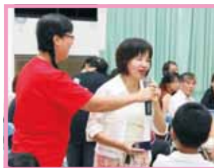
◀老師和新生們踴躍參與有獎徵答活動，讓迎新活動high到最高點！