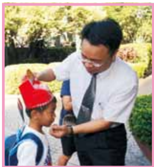
校長為新生配戴象徵出入頭地的狀元帽，期許新生成為出類拔萃的人才。

一、今年8月30日舉辦的新生入學迎新活動，特別以「古禮新循謝親恩·大手小手迎新生」為主題，歡迎新生及家長加入延平這個大家庭，除了依循古禮設計新鮮人過關活動，並結合故事戲劇志工團演出小阿力的大學校，祝福新生展開健康快樂的學習之路。