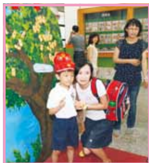
擁抱媽媽說出感謝的話，再從平安樹上摘下平安菓，提醒新生在平安喜中勿忘父母養育的恩情。