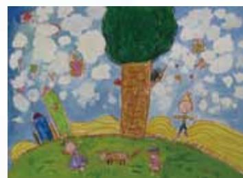
103 傅靖涵 / 童畫世界