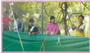
我可是超級天才釣蛙高手

同學陪同我們一起進行各項學習課程，讓我們對於「華南咖啡原鄉」留下非常深刻的印象，也完成第二天的特色遊學課程。