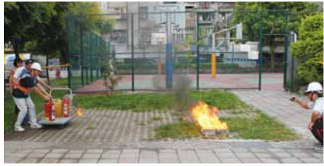
▲複合型防震防震暨防災演習