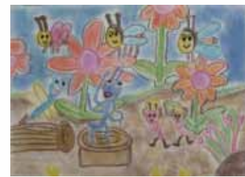
403 陳韋伶 / 勤勞工作趣