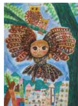
502 周芷婕 / 失去森林的貓頭鷹