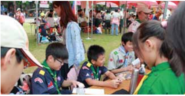
▲童軍團集會~空中大會闖關活動