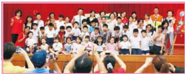
校長暨所有演出人員和新生合影，留下難忘的回憶！

二、9月9日晚上的學校日活動，感謝家長們的熱烈參與，透過級任、科任老師的報告和親師座談，讓家長更了解如何陪伴孩子成長，成為教育的夥伴。