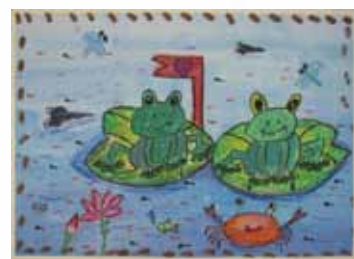
203 曾子謙 / 湖裡的青蛙